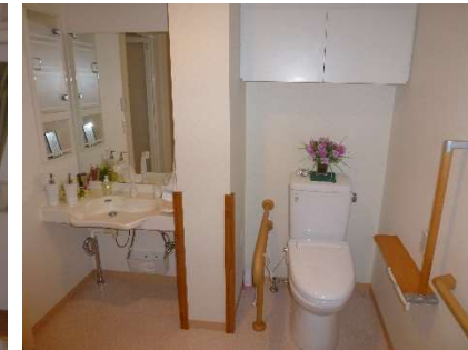
車いすでも使用可能なトイレ