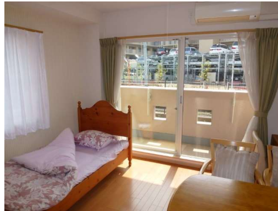
お部屋の様子（介護ベッドをレンタルします）