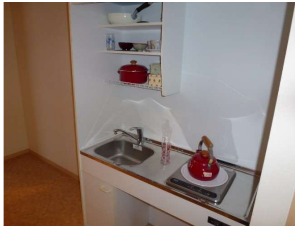
お部屋のキッチン 簡単な料理は可能です